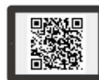
文 | 汽車線上、King Autos https://www.kingautos.net/254193 https://www.auto-online.com.tw/news/0-32098?f=140

Audi表示，透過交通號誌資訊互聯服務，不但可以讓一般的行車更有效率，未來應用在電動車時，也可作為車輛規畫理想行車路徑，並主動介入增加煞車動能以讓電池充電的依據，更是未來自動駕駛的基礎資訊之一。