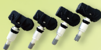
OE replacement (全球車廠OE原廠替代件)