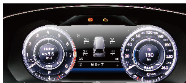
升級後 精美車子搭配胎壓數值