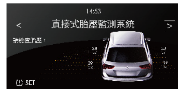
升級後 看見胎壓數值，更安心