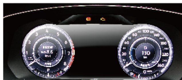
安裝前 沒有胎壓選項