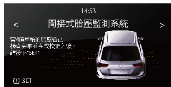
安裝前 沒有胎壓數值