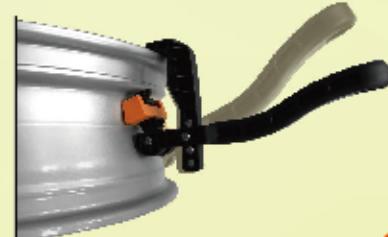
Cobra 2K TPMS橡膠氣嘴安裝工具