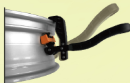
Cobra 2K TPMS橡膠氣嘴安裝工具