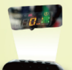
中華三菱OUTLANDER (抬頭顯示系統)