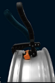
Cobra 2K TPMS 橡胶气嘴安装工具