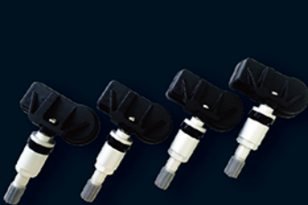
OE replacement (全球车厂OE原厂替代件)