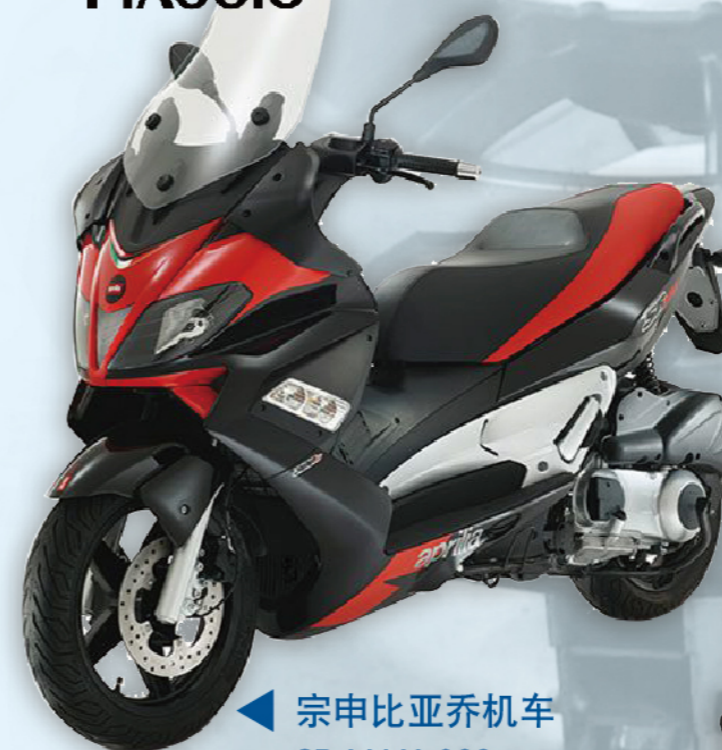
宗申比亚乔机车 SR MAX 300