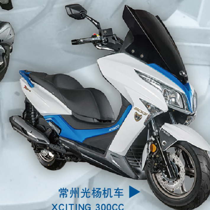
常州光杨机车 XCITING 300CC